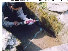
水路のひび割れ補修