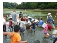
ため池の外來種駆除