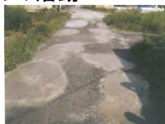
農道の窪みの補修